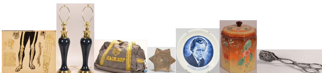
Ljósmyndir af nokkrum aðföngum 2017, sem fylgja skráningu þeirra í sarpur.is.

Að auki komu 12 aðföng án tengsla inn í safnið.